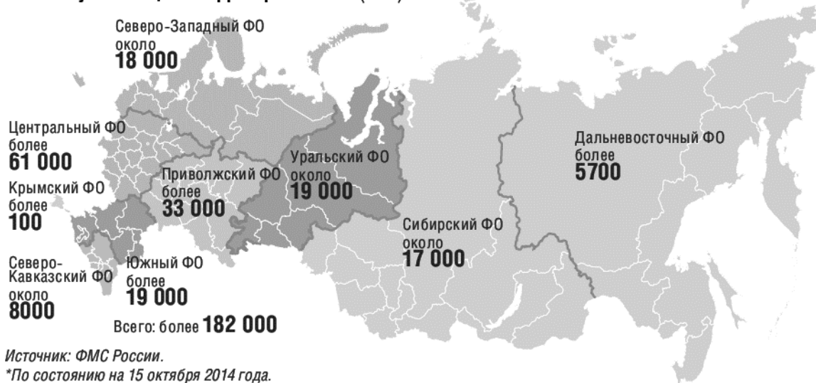
Рис. 1. Количество граждан Украины, состоящих на учете в качестве получивших временное убежище или статус беженца на территории России.

Для выявления особенностей интеграции вынужденных мигрантов из Украины воспользуемся материалами социологического исследования 2014 г. «Проблемы украинских беженцев в России» 14 . Опрос проводился в Пермском крае, Московской, Липецкой, Ростовской, Белгородской, Волгоградской, Воронежской, Свердловской областях и ряде других субъектов Российской Федерации, всего было опрошено 593 чел. 15 . Было выявлено, что после пересечения границы почти каждый третий опрошенный (30,6%) остановился у родственников, каждый четвертый (25%) арендовал жилье. Примечательно, что 14,1% бесплатно пустили пожить к себе незнакомые люди, откликнувшиеся на сложившуюся ситуацию. Часть опрошенных (13,1%) оказались в стационарных пунктах временного размещения (ПВР). А 12,9% указали, что прошли через приграничные палаточные лагеря, развернутые российским МЧС. На основе этих данных